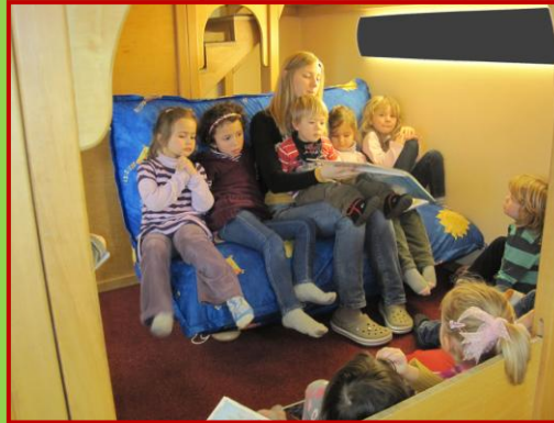
In der Lesecke