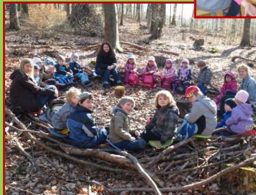
Frühstück am Waldsofa

"Nicht das Kind soll sich der Umgebung anpassen, sondern wir sollten die Umgebung dem Kind anpassen."